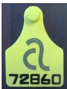
FIGURA 1. Brinco padrão do Programa Terneiro Angus Certificado

Os terneiros (as) aprovados receberão o brinco padrão do Programa Terneiro Angus Certificado, na cor amarela, com numeração sequencial, conforme demonstra a FIGURA 1.